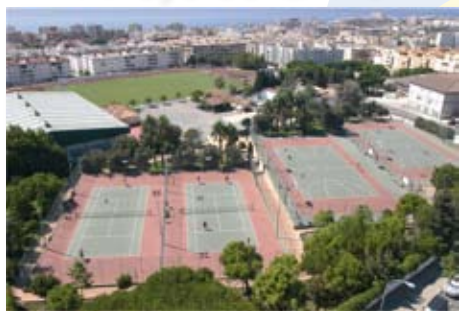
Polideportivo Arroyo de la Miel