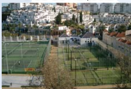
Club de Raqueta