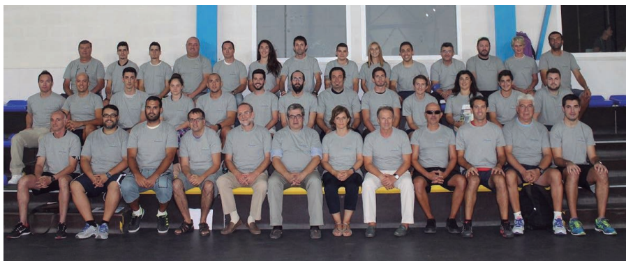
Técnicos de las Escuelas Municipales 2016 / 2017

Patronato Deportivo: C/ Orujo 2. 29631 Benalmádena