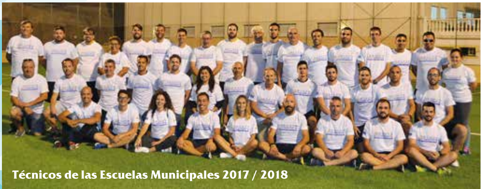
Técnicos de las Escuelas Municipales 2017 / 2018

Patronato Deportivo: C/ Orujo 2. 29631 Benalmádena Tel. 952 577 050 Fax: 952 577 138