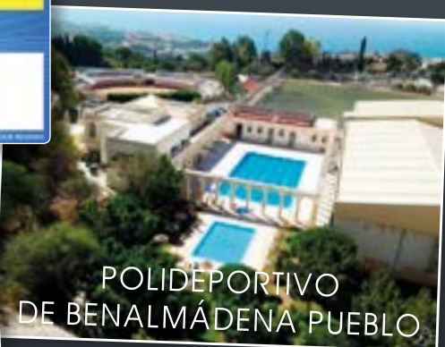
POLIDEPORTIVO DE BENALMÁDENA PUEBLO