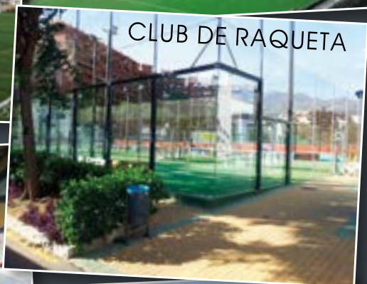
CLUB DE RAQUETA