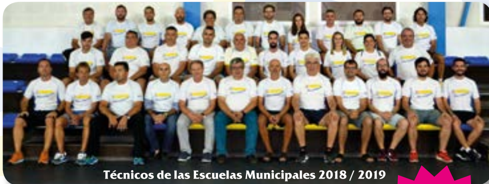
Técnicos de las Escuelas Municipales 2018 / 2019

Patronato Deportivo C/ Orujo 2. 29631 Benalmádena Tel. 952 577 050