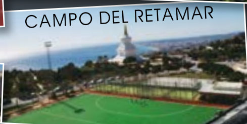
CAMPO DEL RETAMAR