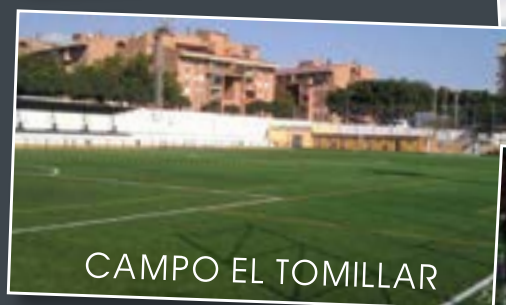
CAMPO EL TOMILLAR