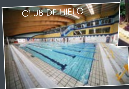
CLUB DE HIELO