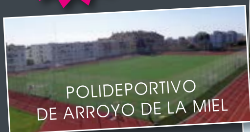
POLIDEPORTIVO DE ARROYO DE LA MIEL