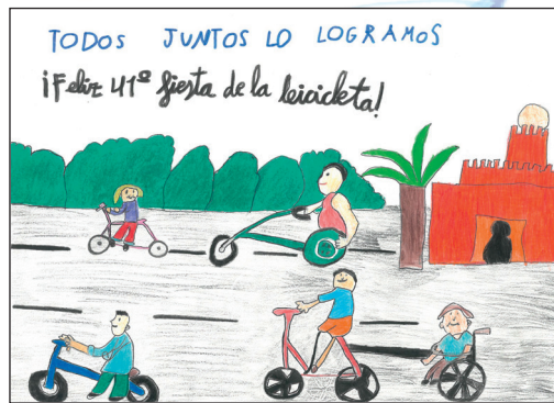
2º Puesto Concurso Cartel: "Todos juntos lo logramos" TRIANA P. T. 2º CEIP MIGUEL HERNÁNDEZ.